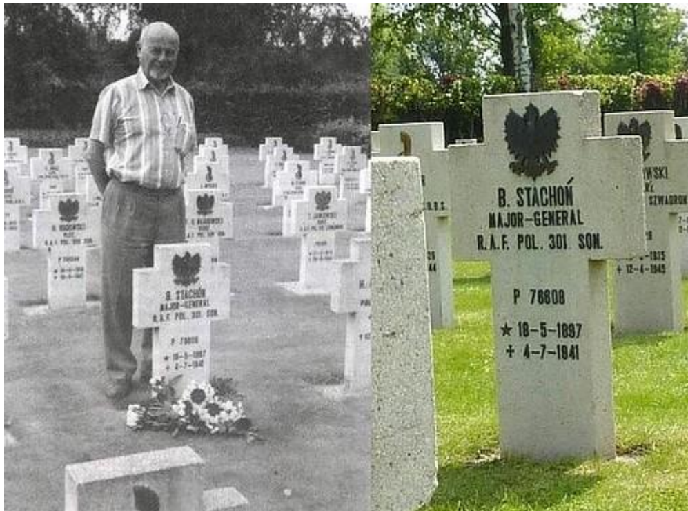
De zoon bij het graf van zijn vader.

gestraft voor zijn meevliegen in de bommenwerper: hij wordt met de lagere rang van brigade-generaal ter aarde besteld: postuum gedegradeerd dus. Zijn zoon weet dat later met heel veel moeite ongedaan te maken. Hij is gerehabiliteerd.